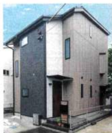
玄関側から見た外観。壁材を貼り分け印象的なデザインに

正式社名 (株) ハウステックス 住所 東京都杉並区永福 4-13-3 TEL 03-6379-5960 URL http://www.housestecs.co.jp