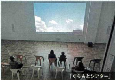
「くらもとシアター」