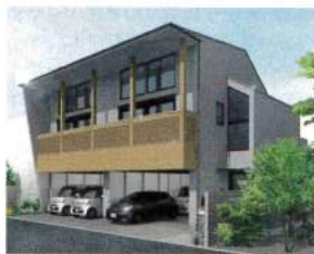
ショールームから徒歩3分で完成見学会を同時開催「永福ガレージ賃貸ハウス」

上で紹介する杉並ショールームでは夏祭りイベントと同時に、自社設計・施工の自社物件の完成見学会を開催する。見学した後は、そのまま「無料プラン相談会」にも参加できるので、家づくりをお考えの方は、お気軽にお問い合わせを。叶えたい暮らしは、このイベントから、はじまる。