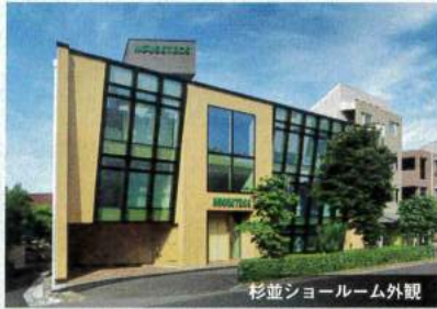
杉並ショールーム外観