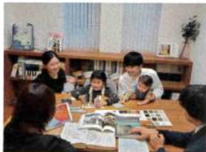
個別に行われる「無料プラン相談会」

※株式会社LIXIL主催「LIXILメンバーズコンテスト」において、2012年度～2022年度の10年連続で受賞している(2020年度は中止)