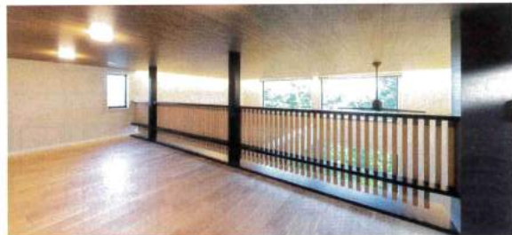
2階リビングから固定階段で往来できるロフト。見事な縦格子のデザインは左右両端に隙間をつくり、キャットウォークから猫が出入りできるように工夫されている