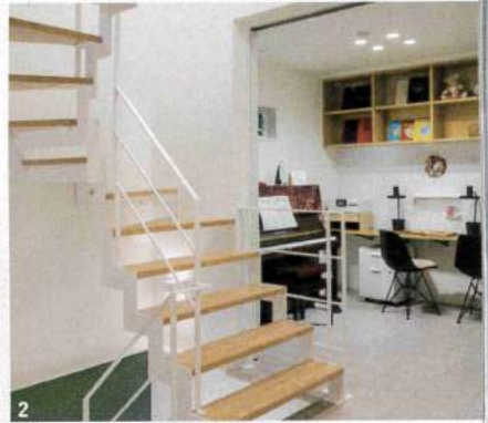
1 / 全館空調のダクトスペースを利用した天井間接照明により、すっきりとスタイリッシュな空間を演出 2 / 階段の奥にはスタディコーナーを設置 3 / ヘリンボーンの床、スチール製の桁と木製踏板を組み合わせたモダンな玄関 4 / バルコニーにつながる洗面室&ユーティリティスペース (写真は0邸)