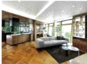
2階にあるショールーム