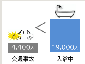
年間死者数の比較 ※2